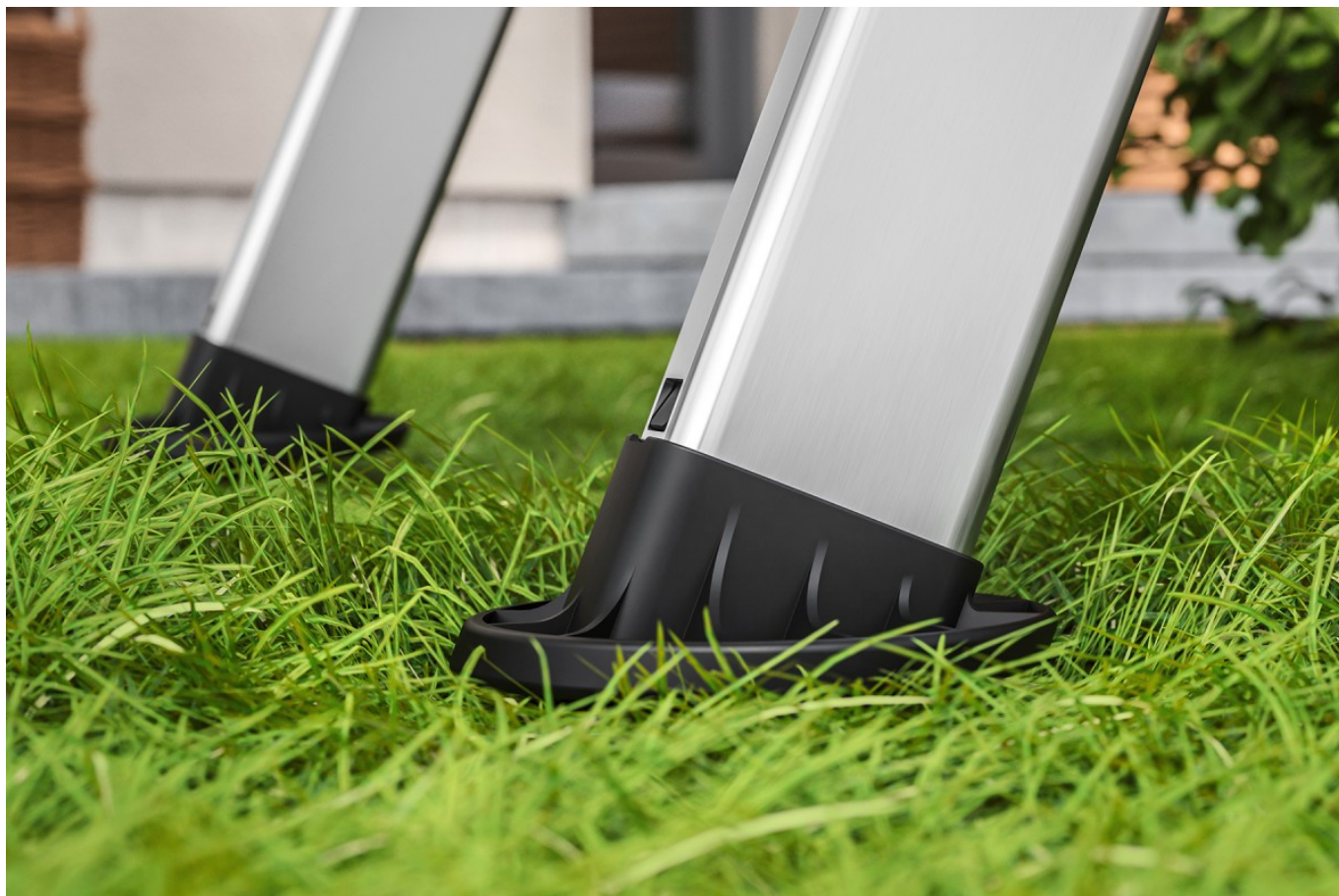
Stabilne ustawienie w ogrodzie, bez osadzania się w podłożu