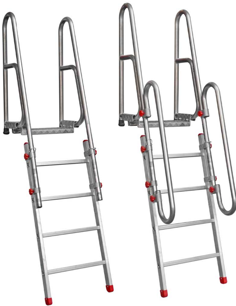
*Zdjęcie modelu SCR4