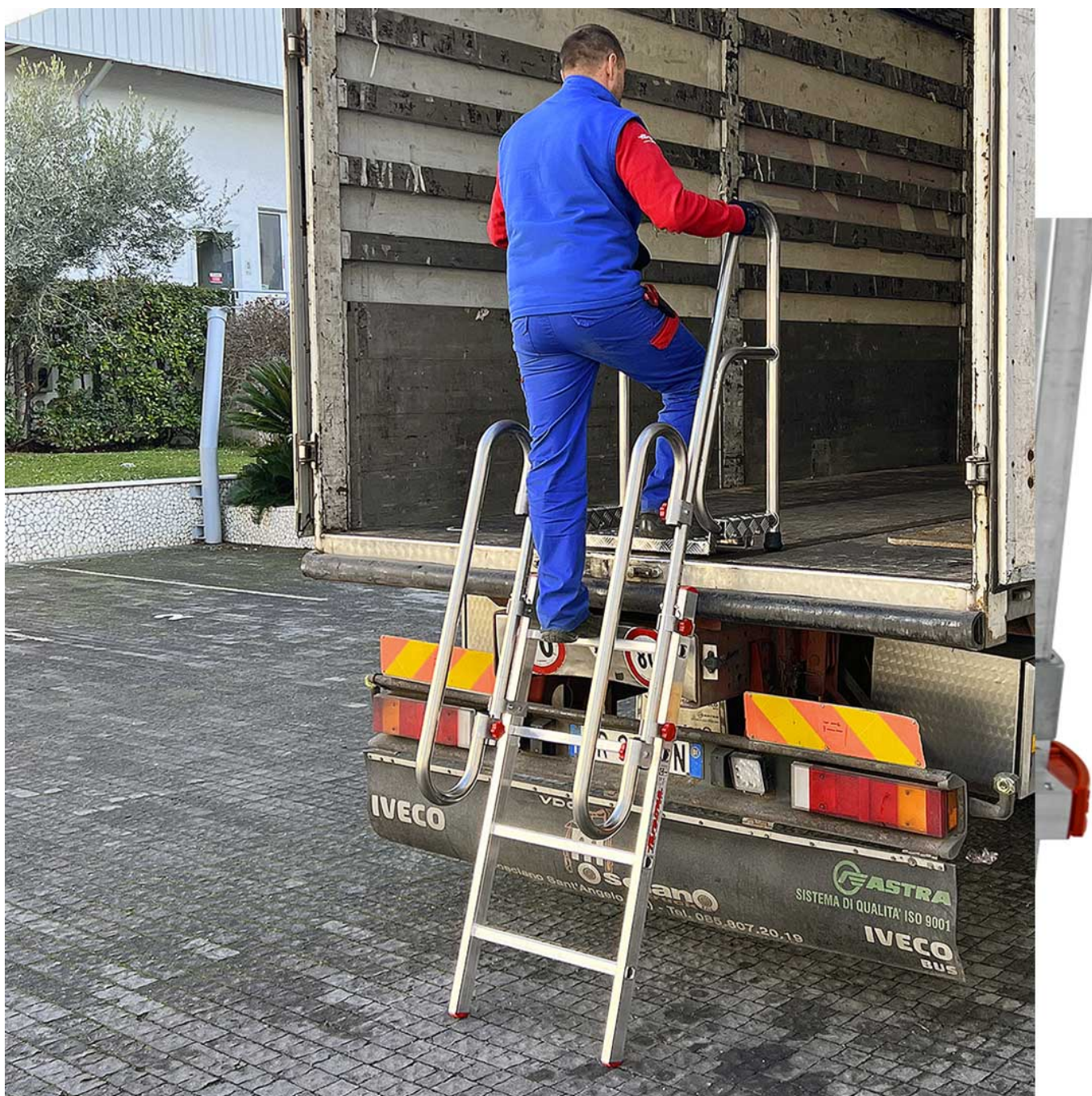
*Zdjęcie modelu SCR4