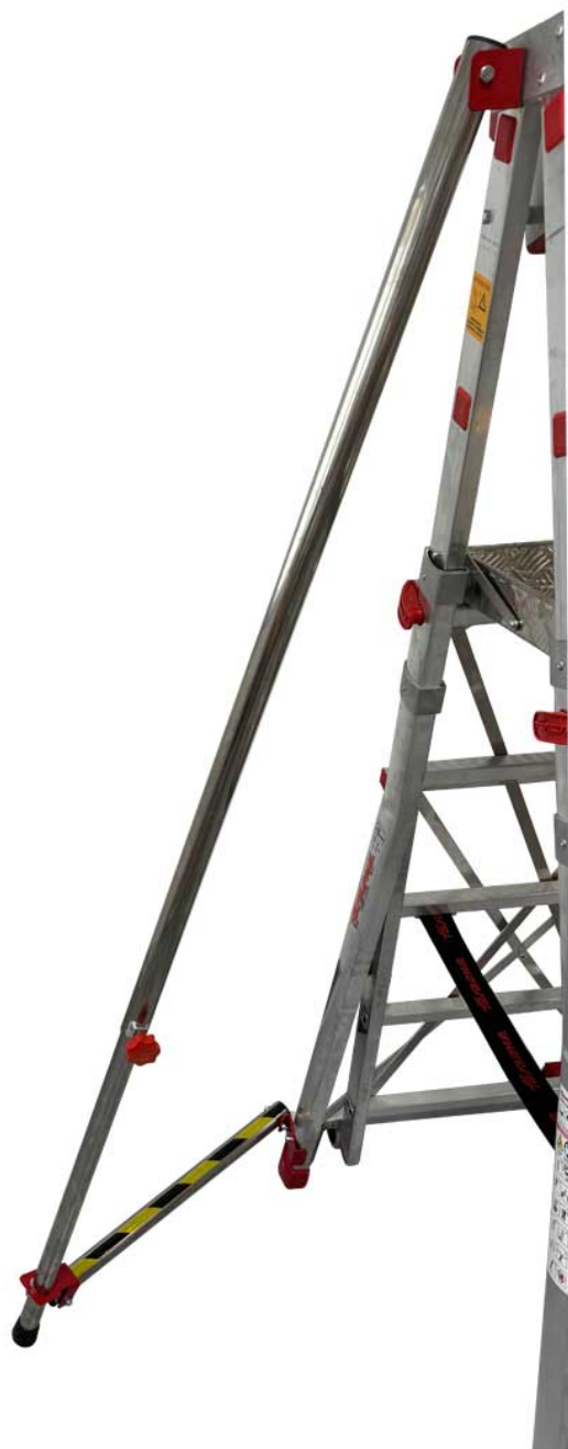
*Rysunek przedstawia model PLS55