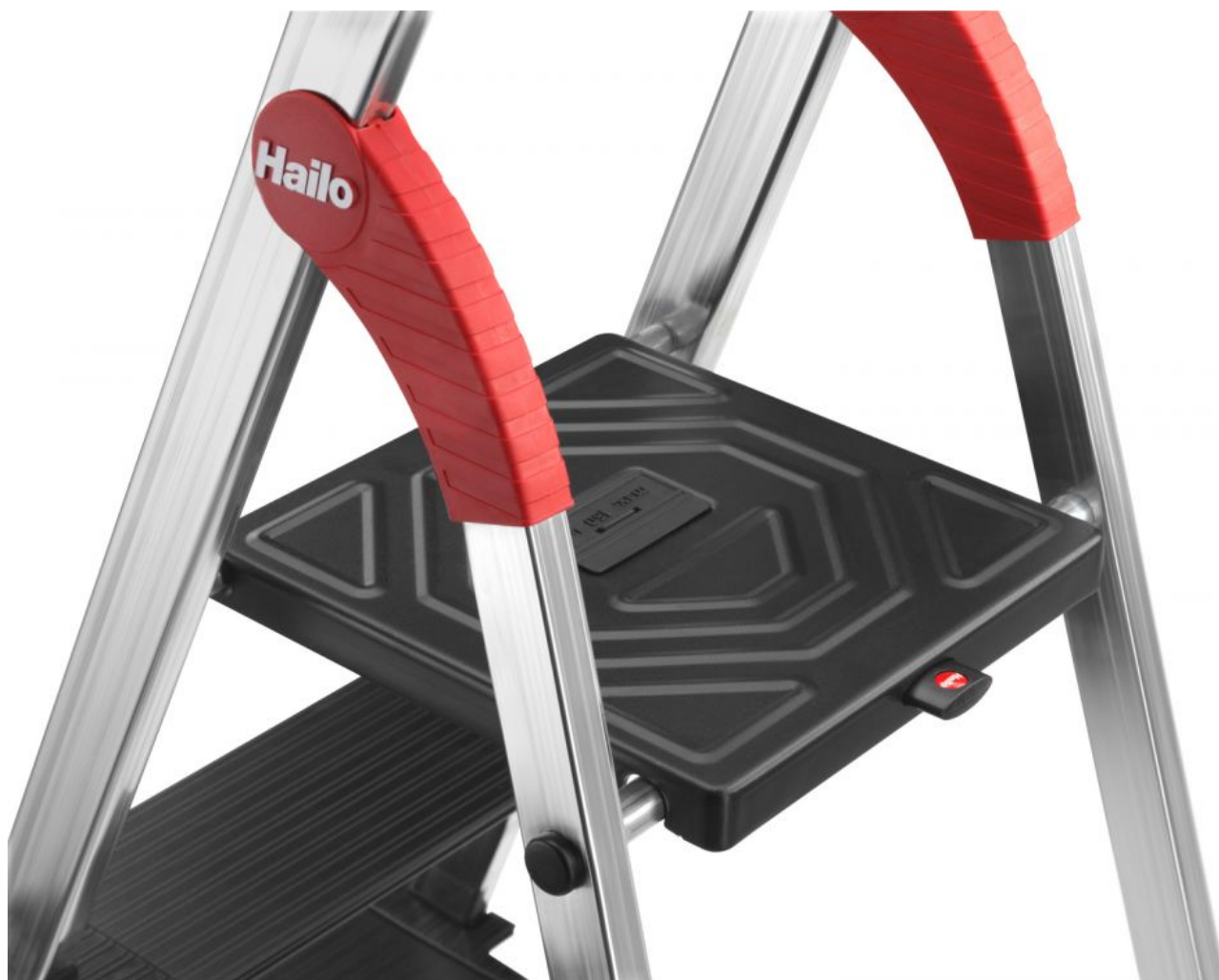
Ocynkowana, stalowa platforma malowana proszkowo o powierzchni antypoślizgowej