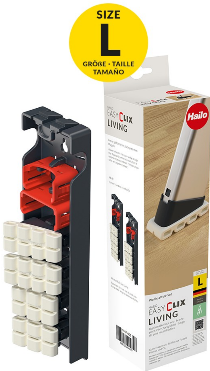
Zestaw wymiennych nóżek do drabin Hailo EasyClix Living