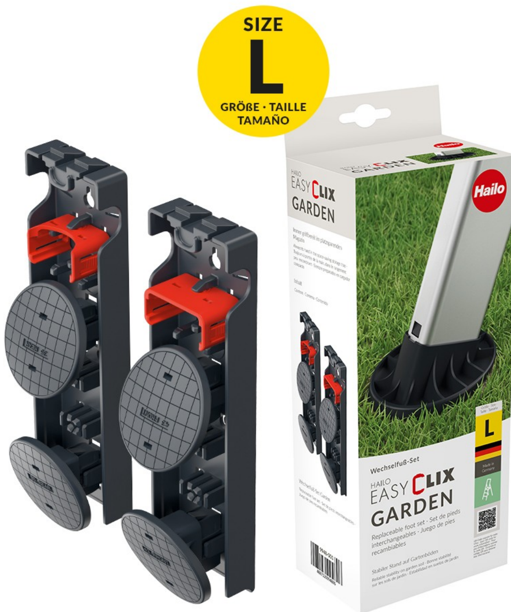
Zestaw wymiennych nóżek do drabin Hailo EasyClix Garden