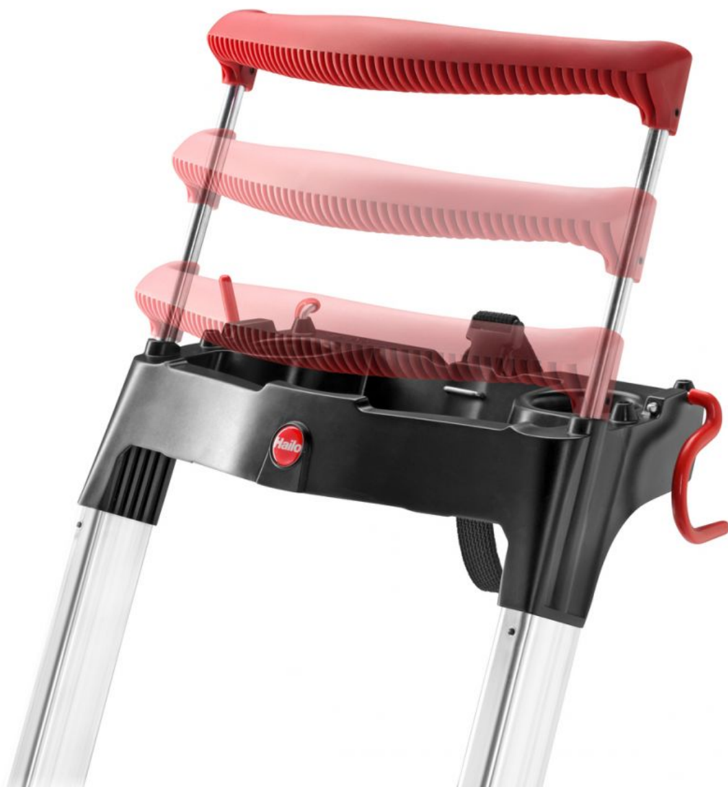
Wysuwany uchwyt bezpieczeństwa do trzymania się podczas prac na platformie