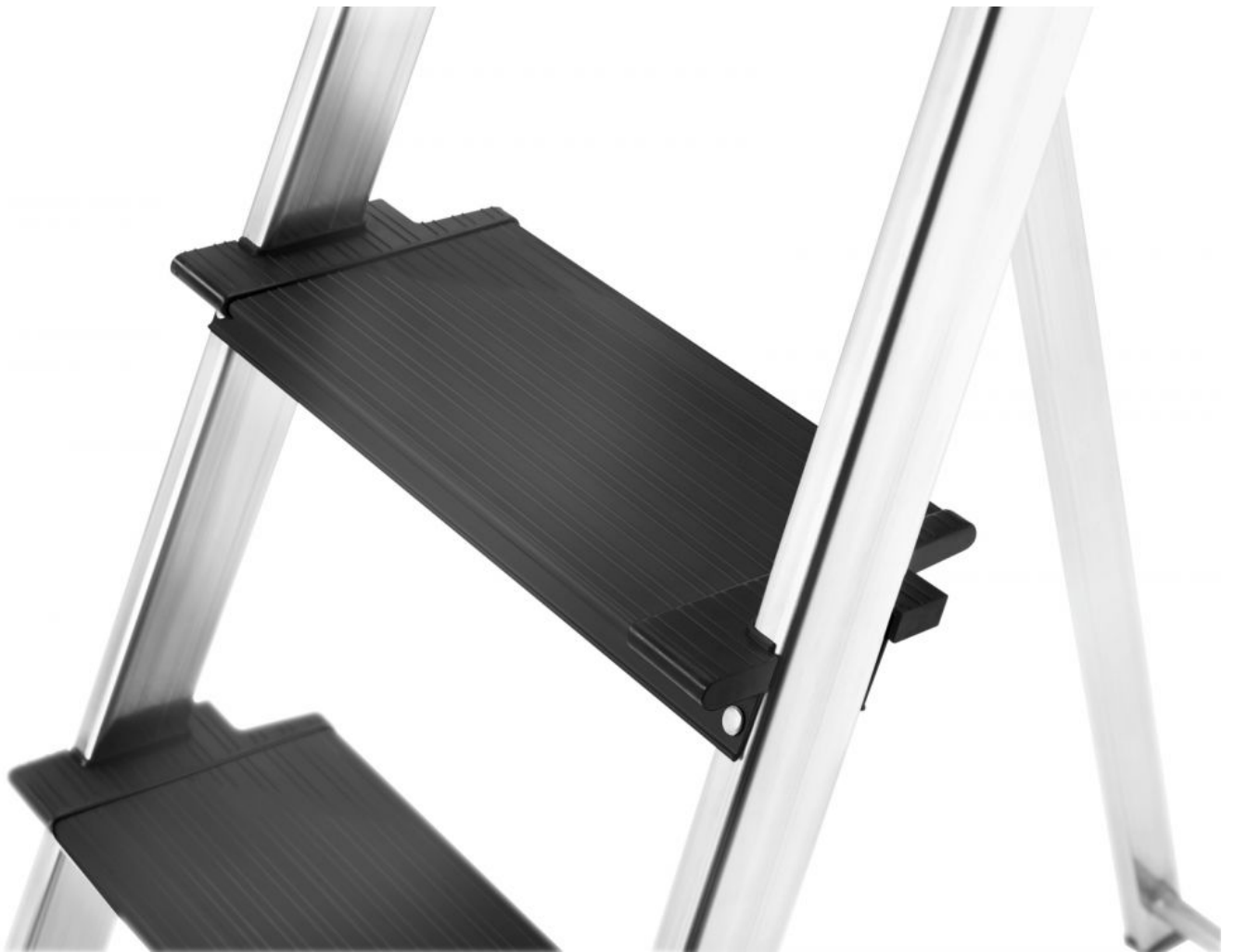
Czarne aluminiowe stopnie XXL ze struktura antypoślizgową i ekstra głęboką powierzchnią do stania