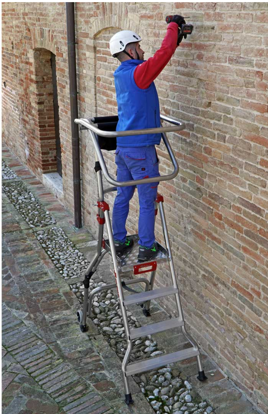
*Zdjęcia przedstawiają model PL4.C