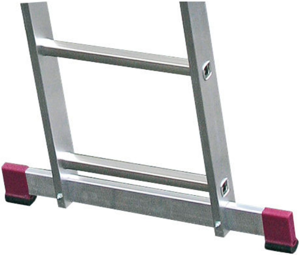
Stabilizator poprawiający stabilność drabiny